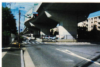
のぼりまちなみこう さてん ⑪登 町南 交差点 しんこうむし わた ひと 信号無視で渡る人 きけん (登町 18)