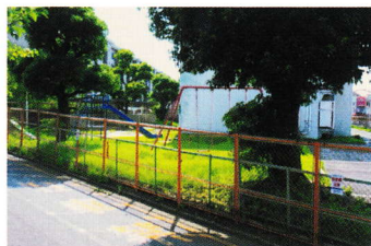
かんでんしゃたく あき や ⑭関電社宅 (空き家) しき ちない はい 敷地内に入らない (登町 5)