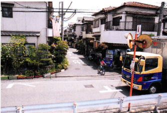
と だ ちゅうい ⑨飛び出し注意 (下田部 2 丁目 29)