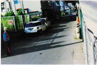
しんかんせんこうかした ①新幹線高架下 ほどう 歩道がない (登町 61)