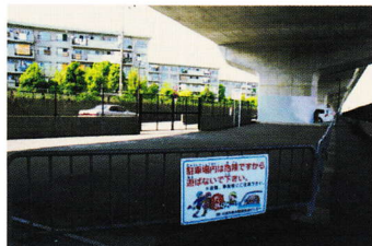
じゅつたかせんこう かしたひろ ば ⑩十 高線高架下広場 あそ バスケなどの遊び きんし 禁止 (登町 16)