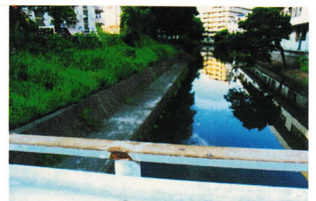
すいる さかなつ ④水路で魚 釣り きけん (登町 35~)