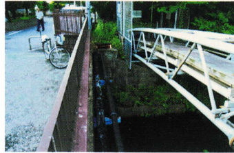
さく ⑥柵をのりこえて カメとりはきけん (登町 34~)