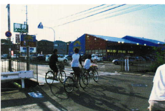
どうろ おうだん ⑰道路横断はきけん (下田部 2 丁目 20)