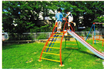
こうえん みとお わる ⑦公園の見通し悪く しかく おおい 死角が多い (登町 20)