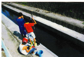
すいる さかな ⑮水路に入って魚 つ 釣りはきけん (下田部 2 丁目 36)