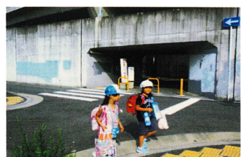
じゅつたかせんそくどう ⑳十 高線側道 ひととお すく 人通りが少ない (堤町 18~23)