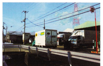
でいり ⑯トラックの出入り あり通行に注意 (下田部 2 丁目 25)