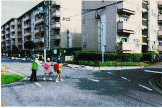
にしこうさてん ⑤B22 西交差点 こうつうりょうおお ちゅうい 交通 量多く注意 (登町 35)