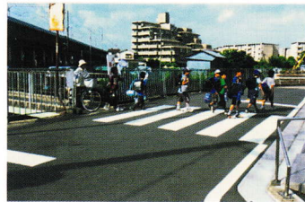
きんき おおさかぎんこうまえ ②近畿大阪銀行前 こうつうりょうおお ちゅうい 交通 量多く注意 (登町 52)