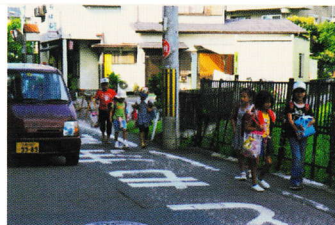
しんかんせんした どうろ ③新幹線下道路 ほ どう せまく 歩道が狭くきけん (登町 43)