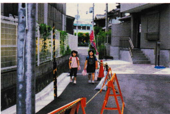
せま みとお わる ⑬狭く見通し悪い ろ じちゅうい 路地 注意 (西冠 3 丁目 33)