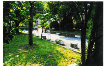
じゅもく しげ おおい ⑧樹木の繁りが多い とうき げこうじどう 冬期下校時等きけん (登町 19)