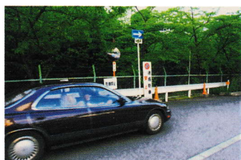
くるま ちゅうい いっぽうつうこう ⑱車に注意(一方通行) だ はしる スピードを出して走る くるま 車あり (登町 3)