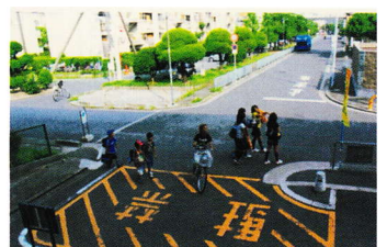
いこ いえまえこう さてん ⑫憩いの家前交差点 おうだんほ どう ちゅうい 横断歩道なし注意 (登町 14)