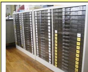
職員室に設置した各種反復学習プリントの整理棚