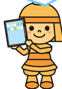
高槻市マスコットキャラクター はにたん