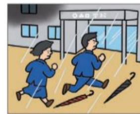
傘などの長いものは持たない。