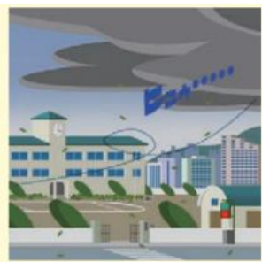
急に冷たい風が吹いてきた。