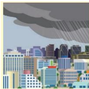
真っ黒い雲が近づいてきた。

この時期になると、さっきまで晴れていたのに…急に雷雨が！ということがあります。その原因は、「積乱雲」という雲です。発達した積乱雲は「急な大雨、雷、ひょう、竜巻」など激しい気象現象を引き起こすのです。 積乱雲が近づくサインがあります。次のようなサインがあると、激しい雨と雷がやってきます。