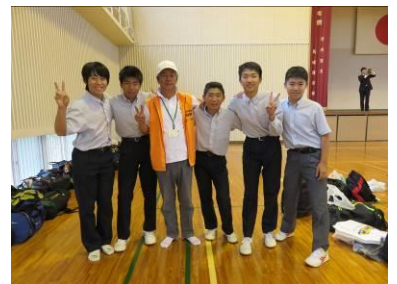
滞在先の方と別れの時