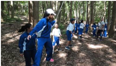
プロジェクトアドベンチャー