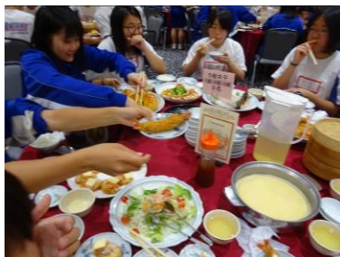
長崎名物「皿鉢料理」