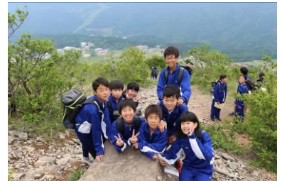
オリエンテーリング