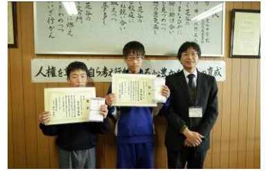
絵手紙作文コンクール 受賞者

また、「第52回手紙作文コンクール」で1年生 さんが絵手紙部門佳作及び暑中見舞い賞、1年生 さんが絵手紙部門佳作をそれぞれ受賞しました。おめでとうございます。