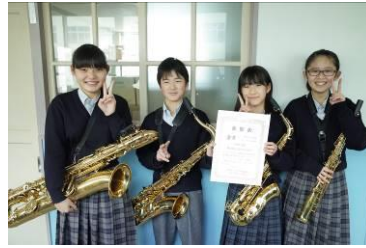
サクソ4重奏 金賞受賞者

1月18日高槻現代劇場で第31回アンサンブルフェスティバルが開催されました。本校からは「サクソ4重奏 金賞」、「金管8重奏 銀賞」、「打楽器4重奏 銅賞」の表彰を受けました。