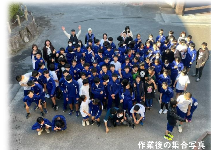
作業後の集合写真

ご協力いただきました地域のみなさま、有志の生徒のみなさんありがとうございました。